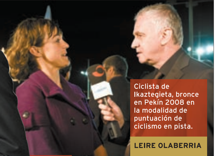
Ciclista de Ikaztegieta, bronce en Pekín 2008 en la modalidad de puntuación de ciclismo en pista.